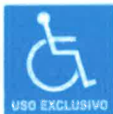
Ubicación de rutas, espacios o servicios accesibles para personas con discapacidad.

Aquellas que facilitan a la población, la identificación de condiciones seguras