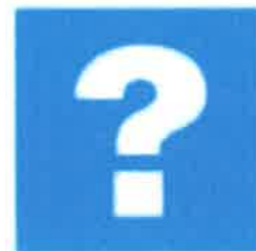
Ubicación de un módulo de información.

6.4 Ubicación. Las señales se colocarán de acuerdo a un análisis de las condiciones y características del sitio o instalación a señalar, considerando lo siguiente: Las señales informativas se deben colocar en el lugar donde se necesiten, permitiendo que el observador tenga tiempo suficiente para captar y comprender el mensaje. Las señales de precaución se deben colocar donde exista un riesgo, para advertir de su presencia al observador y le permita con tiempo suficiente captar y comprender el mensaje sin exponer su salud e integridad física. Las señales prohibitivas o restrictivas se deben colocar en el punto donde exista la limitante, con el propósito de evitar la ejecución de un acto inseguro. Las señales de obligación se deben colocar en el lugar donde sea exigible realizar la acción que la misma señal indica.