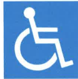
TABLA D 3 Señal que indica la ubicación instalaciones para personas con discapacidad

Ubicación de rutas, espacios o servicios accesibles para personas con discapacidad.