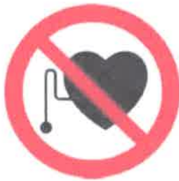
TABLA A 1 Señales de prohibición

Prohibido el paso a personas con marcapasos.